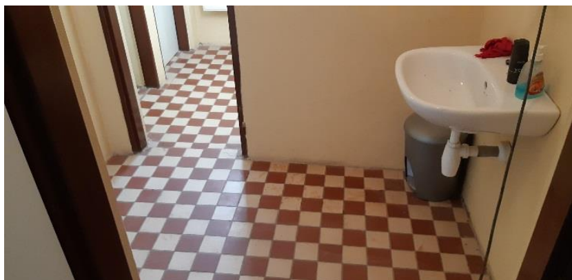
Toalety pred a po rekonštrukcii

Pandémia ovplyvnila aj naše ďalšie plány. Štát výrazne znížil vyplácanie príspevku z podielových daní pre samosprávy. To má za následok, že termín realizácie niektorých našich projektov (výstavba multifunkčného ihriska, výstavba chodníkov na cintoríne) sa posúva a nie je vylúčené, že v týchto projektoch budeme môcť pokračovať až v budúcom roku.