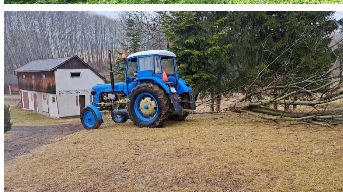
Výrub náletových drevín