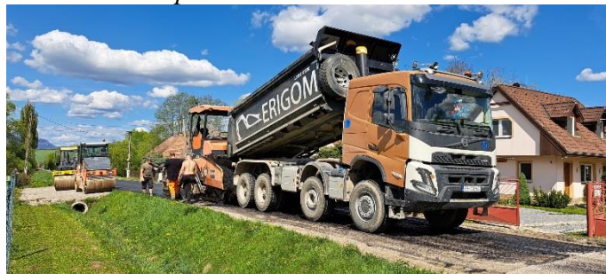
Pokládka asfaltového koberca