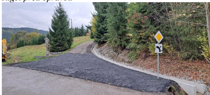
Rigól po oprave

vybudované. Preto je potrebné s takýmito opravami počítať aj do budúcnosti.