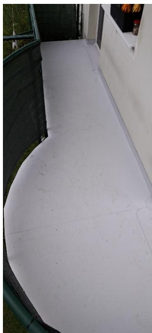
Oprava balkónov: pred a po oprave