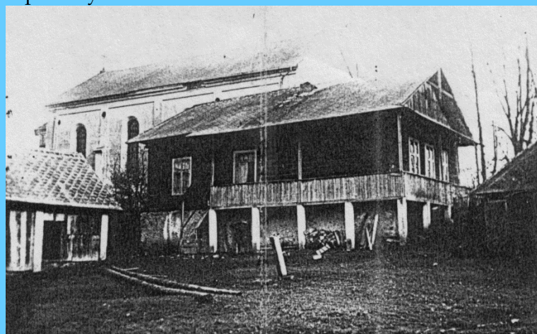
Pamätáte sa? .....Stará škola pri fare

Takže otvárajte rodinné albumy, krabice s fotkami, zabudnuté šuflíky v skrinách a všetky zaujímavé fotografie prineste prosím na obecný úrad alebo p. Andaházymu a staňte sa aj vy tvorcovia výstavy histórie Liptovských Kľáčian.