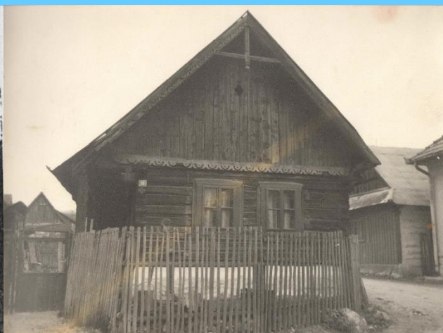
.....Domček Humených na mieste vedľa obecného úradu