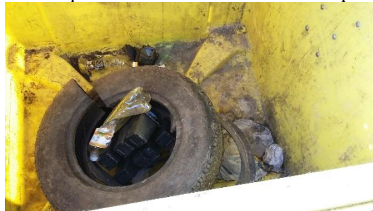
Deň po tom čo vysypali plasty

Treba si uvedomiť, že komunálny odpad platíme 24,31 € za tonu, separovaný zber 3,- € za tonu. Pokosenú trávu tiež radšej hodme na kompost ako za dedinu. Potom sa nečudujme, že sa cena za odpad zvýšila na 12 €.