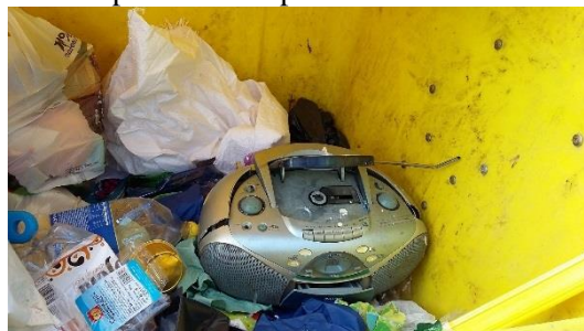
Pár dní po tom čo sa dozbieeral elektroodpad